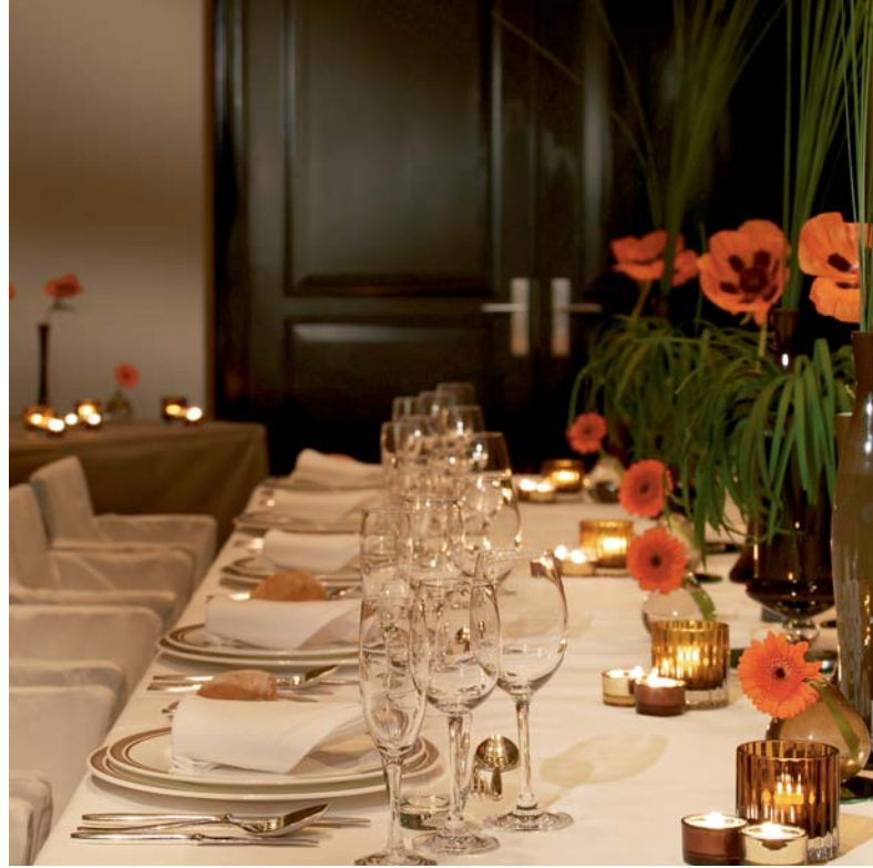
From private meetings to grand galas. Von privaten Konferenzen bis zu großen Galas.