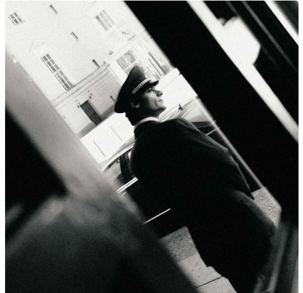
A beautifully restored building that was once the headquarters of a leading German bank. Das wunderschön restaurierte Gebäude war einst die Zentrale der Dresdner Bank.