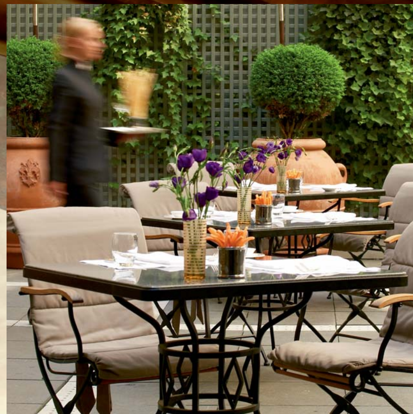
Parioli restaurant features Mediterranean cuisine and a courtyard for al fresco dining. Mediterrane Küche im Restaurant Parioli mit wunderschönem Innenhof.