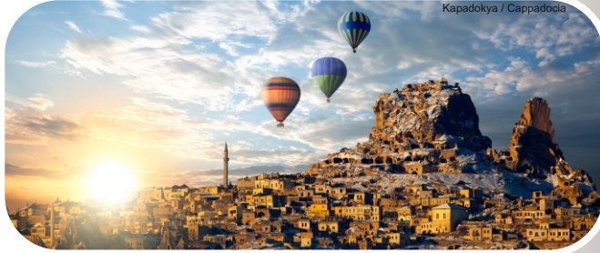
Kapadokya / Cappadocia