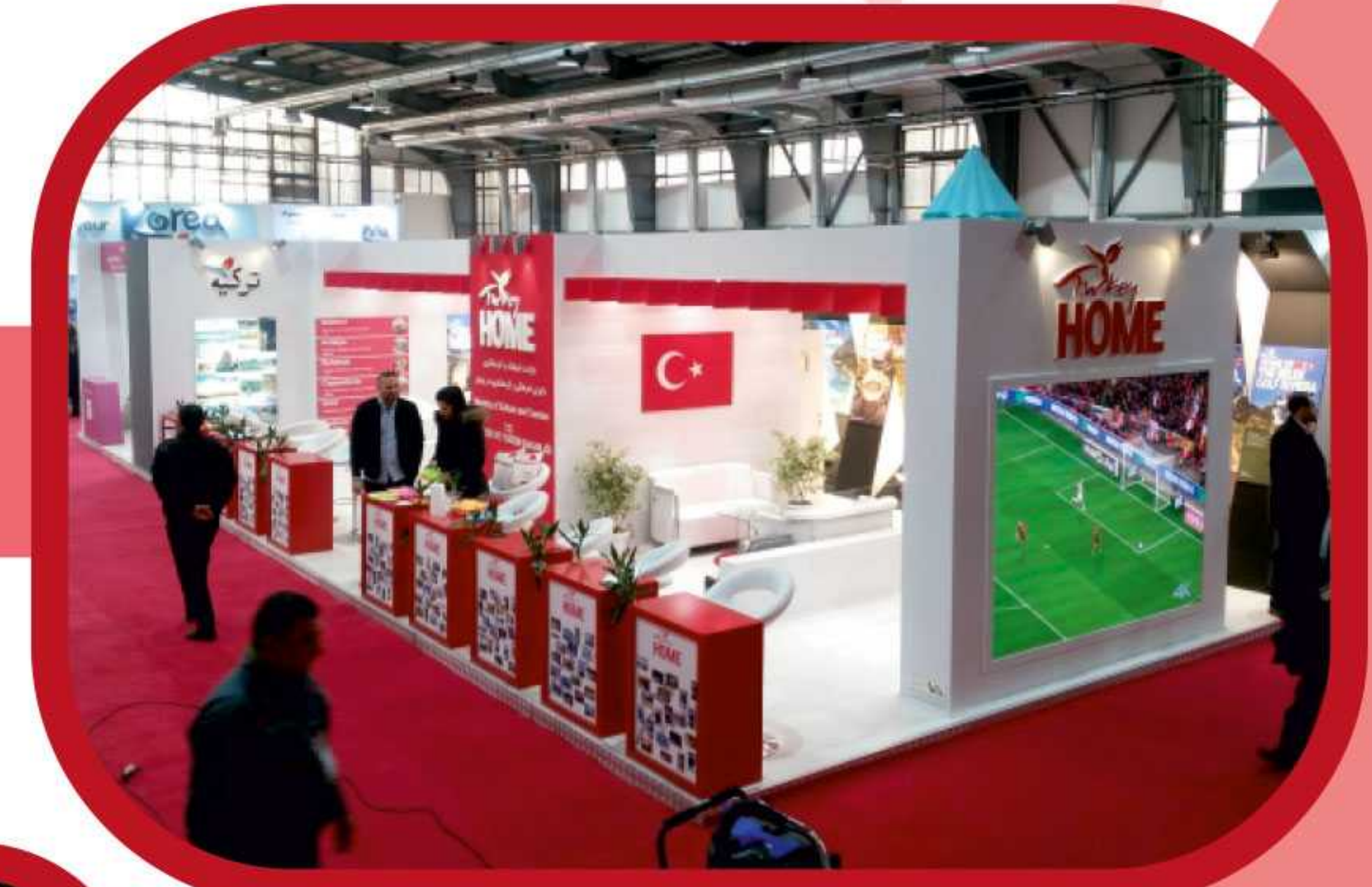
2017 T.I.T.E FUARI