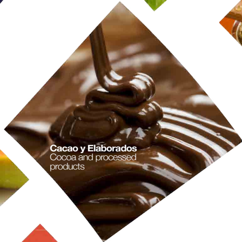
Cacao y Elaborados Cocoa and processed products