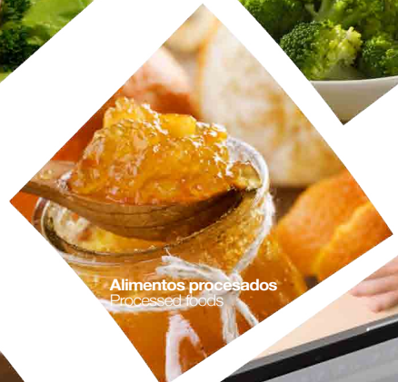
Alimentos procesados Processed foods