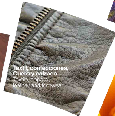
Textil, confecciones, Cuero y calzado Textile, apparel, leather and footwear