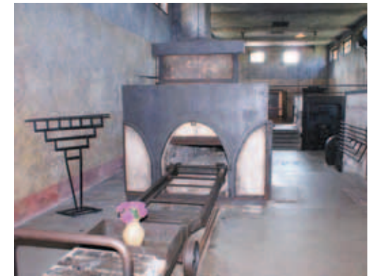
Krematoryum acının, zulmün ve savaşın acımasızlığının izlerini tüm ağırlığıyla taşıyor.

Terezin Kampı'nda yaşananlar ise gerçekte bir film senaryosundan daha çarpıcı. Naziler, Terezin'i, Yahudiler'in tedavi gördüğü bir kaplıca merkezi olarak göstermeye çalışmış. Ancak başka ülkelerde söylenecek ve suçlamalar artınca, tersini ispatlamak için bir plan geliştirmişler. Kalenin kaplıca merkezi olduğu izlenimi yaratmak için gerekli düzenlemeleri yapmışlar. Bu sahte düzenlemenin izleri hala duruyor. Sonrasında da sözde kaplıca merkezini Uluslararası Kızıl Hac temsilcilerinin ziyaretine açmışlar ve onları kandırmayı başarmışlar. Ancak surların ardındaki Yahudiler, acı ve açlık içinde ölümlü bekleyerek yaşamış. Aralarından çok azı II. Dünya Savaşı'nın sonunu görebilmiş.