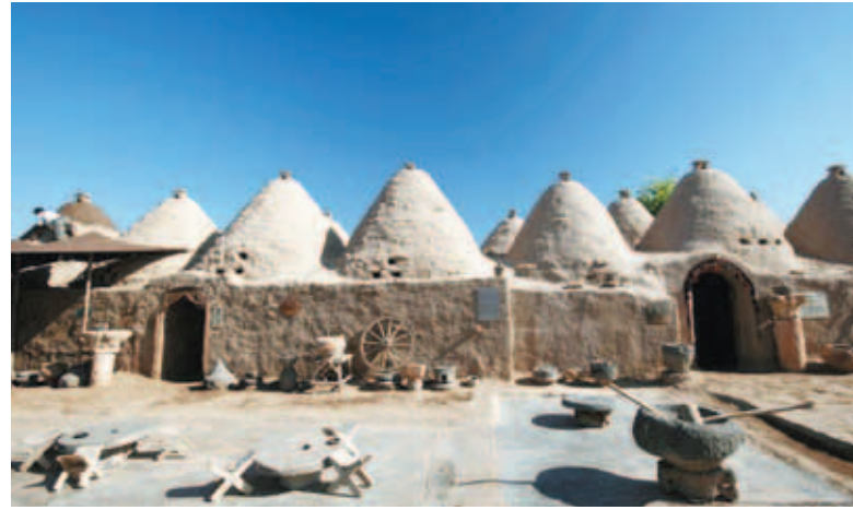
GAP Bölgesi Turizm Odaklı Tanıtım ve Markalaşma Projesi'nde Harran ve Savur'da 'yönetim planları' hayata geçirilecek.